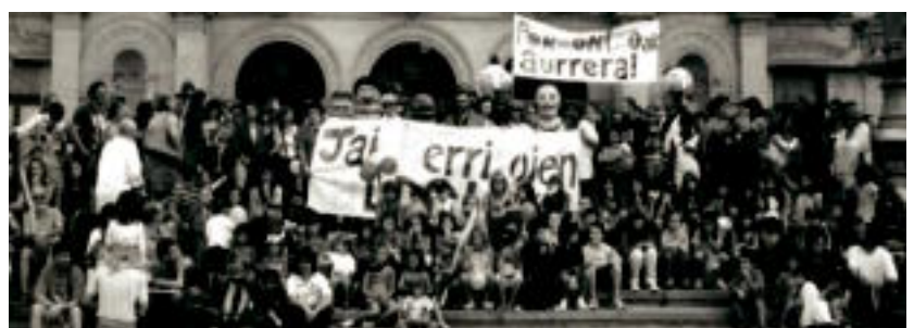
Porrontxo jaien aldeko aldarrikapenak tartea du liburuan. XUDIR KULTUR TALDEA

Arte grafikoko enpresak 'To auzoa, toma barrio' liburua argitaratu du; musikariak, eskultoreak, aktoreak... auzoko artistei buruz idatzi du 011-III