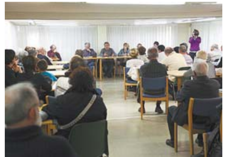
Un momento de la reunión mantenida ayer en Tolosa.

En lo que respecta a nuestra comarca, según el censo de Anadir, se dieron un total de treinta casos en aquella época entre las clínicas San Juan (desaparecida), San Cosme y San Damián (desaparecida) y la Clínica de la Asunción de Tolosa. «Pero no fueron adopciones –insistieron desde Anadir– fueron apropiaciones y eso hay que denunciarlo».