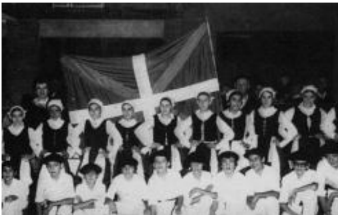
Bere sorreratik, 1.000 lagun baino gehiago pasa dira Trebeska dantza taldeak.