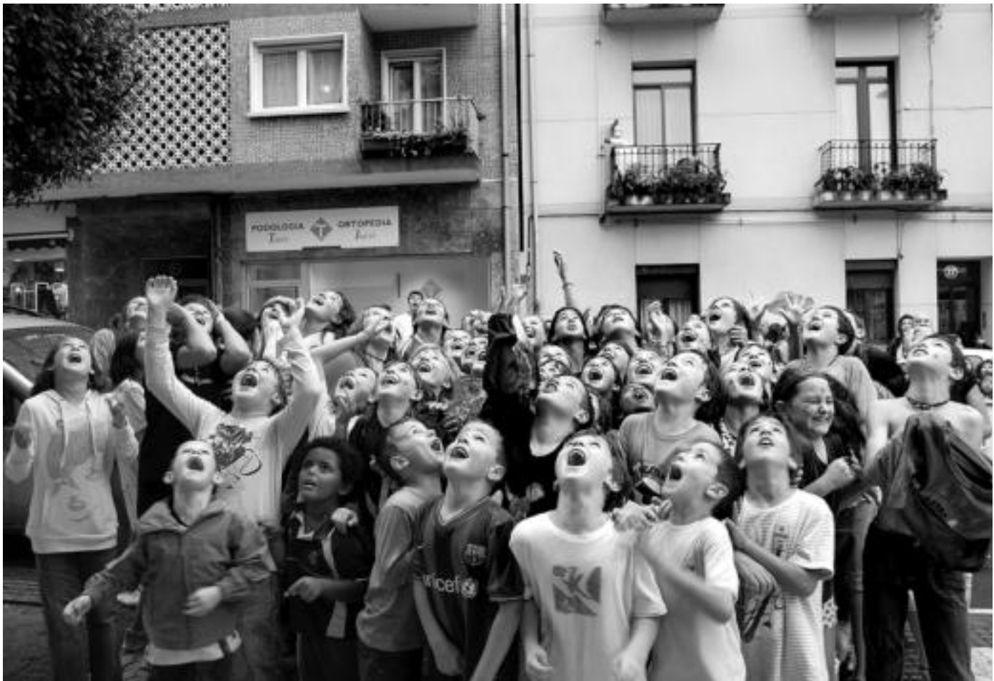
Jai herrikoien aldeko aldarrikapena egin dute liburuan. Irudian, Egiako haurrak, Porrontxoetan. MAITANE ALDANONDO

Egia artistez betetako auzoa dela erakutsi nahi izan du Ipar arte grafikoko enpresak; bere 25. urteurrena aitzakiaz hartuta, bizilagun eta taldeen ekarpenak jaso ditu 'To auzoa, toma barrio' liburuan. Gaiak luzerako ematen du.