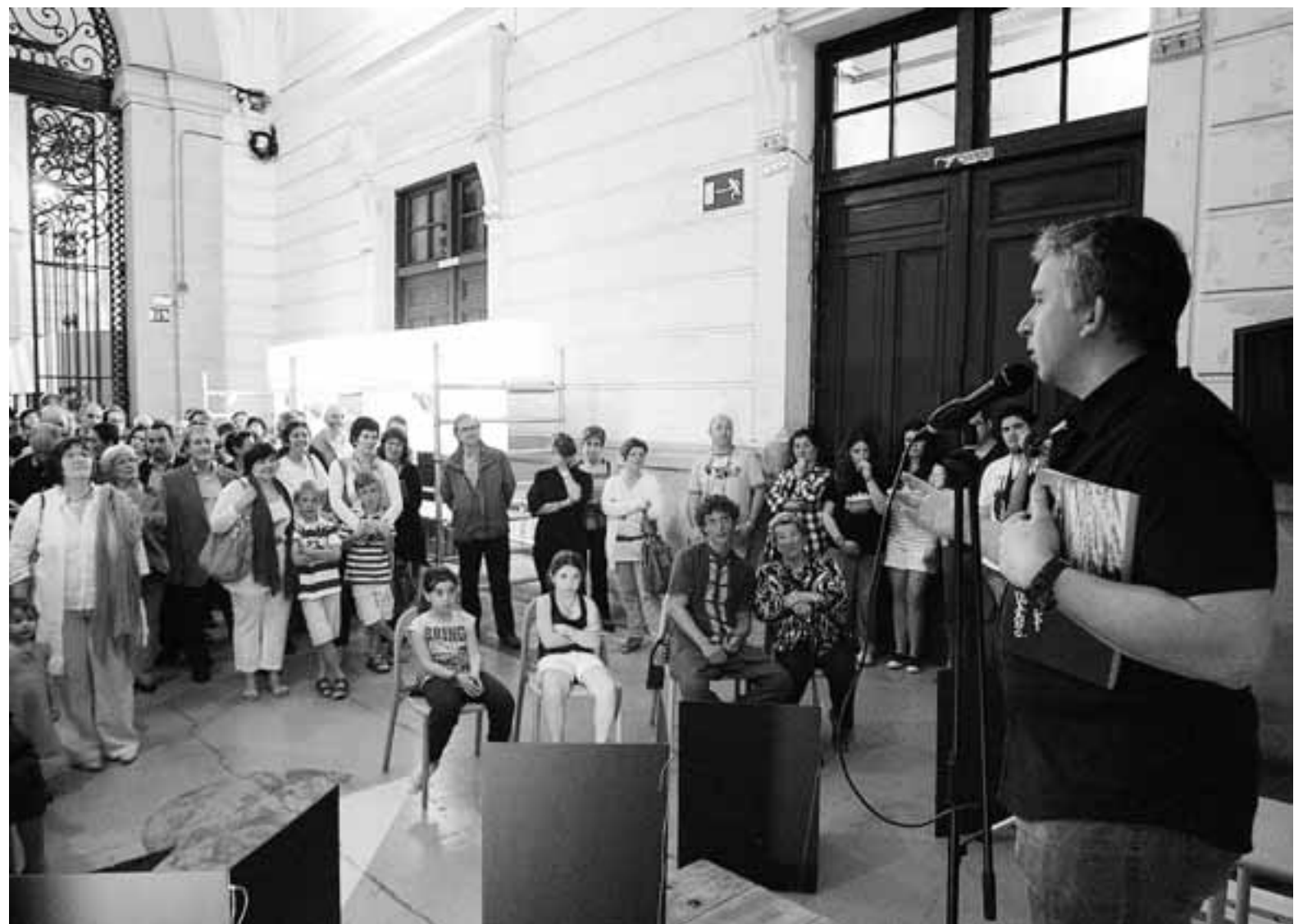
Un centenar de egitarras asiste a la presentación del libro 'To auzoa, toma barrio' en Tabakalera, el pasado viernes.

Tal y como cuenta Agirrezabal, “en Egia no se nota” todo el talento ocul-