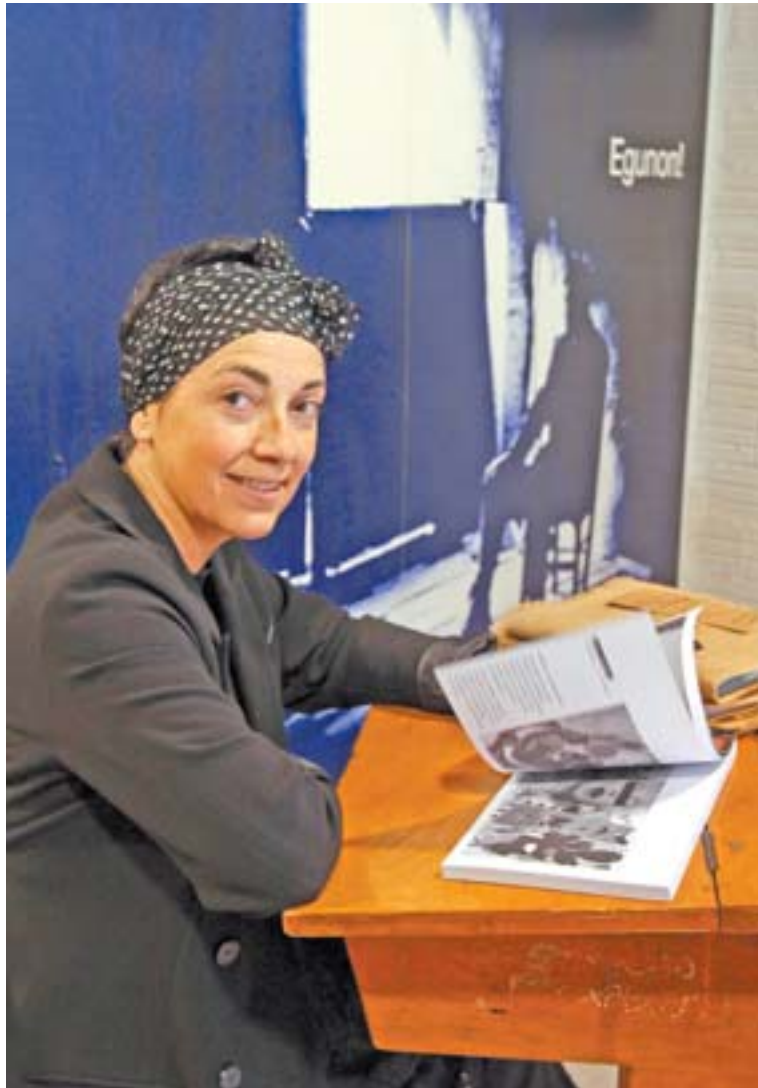
Tejería 12. Una calle, un libro y Karmele, de Ipar, Gráficas. :: N. IRAOLA

– Lo digo porque ahora la gente está muy reacia a usarlo pensando en los árboles de la Amazonia, en los bosques del Brasil. Pero deben recordar que el de las artes gráficas es un mundo de materiales reciclables que se utilizan y se reutilizan. Los clientes quieren que todo pase por el ordenador: 'Te mando un pen drive, te envío un e-mail, te lo meto en un cd'. Y no es eso, te juro que no es eso. Un impresor necesita hacer copias en papel. Tiene que tocar lo que luego encuadernará. El ordenador es una herramienta absoluta pero una errata o un fallo en la elección del tipo de letra son cosas que se deben poder tocar, subrayar, anotar. Y además, un cd no huele. El papel, sí. Este